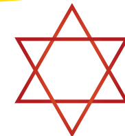
“ESTRELLA JUDÍA” una estrella de seis puntas